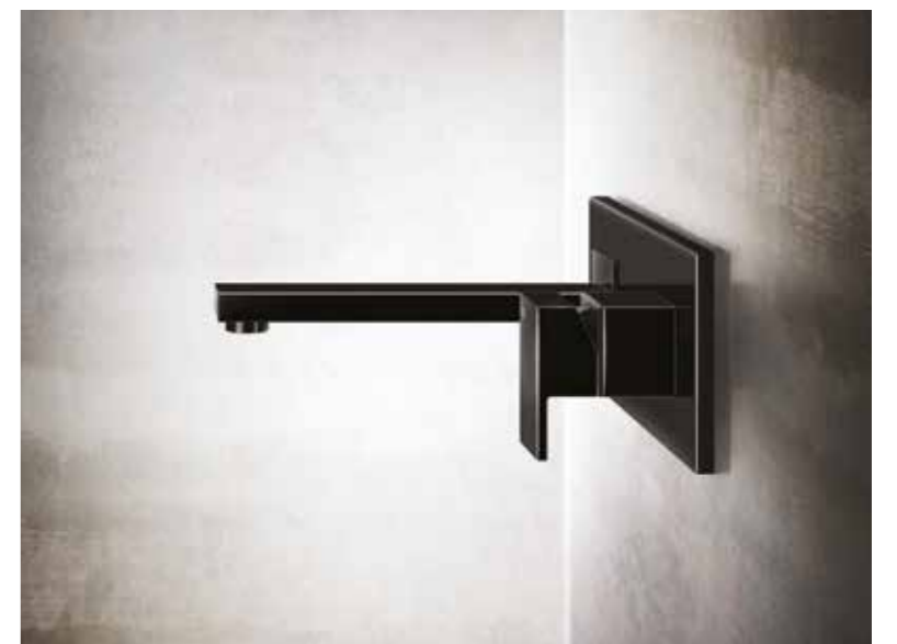
20002#706 Basin mixer, without waste / Miscelatore lavabo senza scarico