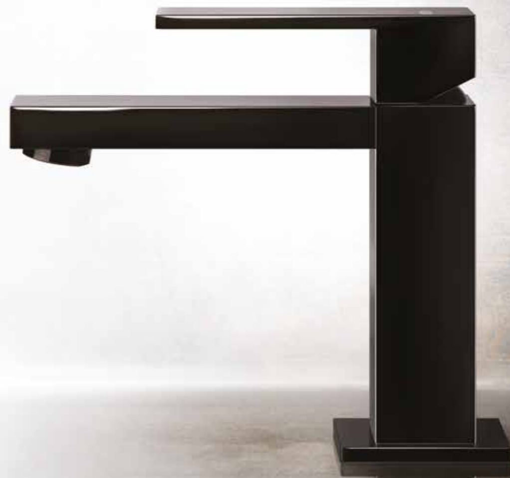
52011#079 Three-hole basin mixer / Gruppo lavabo tre fori

Rettangolo nasce da un gesto di libertà creativa, dalla esplorazione originale e ironica di simboli iconici, di forme semplici ma evocative. Il Rettangolo è segno geometrico sorprendente e inusuale per la rubinetteria, perfetta dimostrazione di come il design, con la sua capacità di infondere un contenuto d'arte viva e vivibile nei prodotti di consumo e uso quotidiano, arricchisce gli spazi in cui abitiamo, rendendo speciali i luoghi e i gesti semplici di ogni giorno.